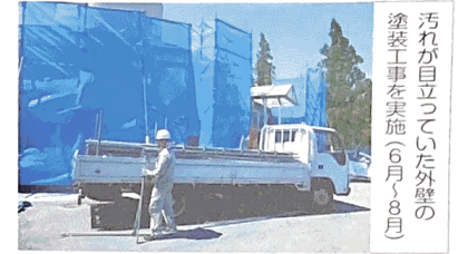
汚れが目立っていた外壁の塗装工事を実施(6月~8月)