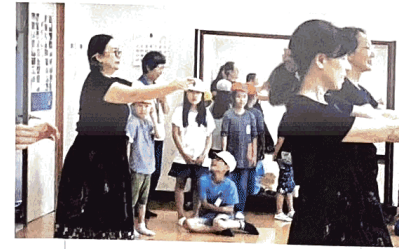
地域学習で築山小学校2年生が「コミセン探検。(6月)