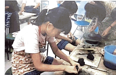
陶芸サークル燐が小学生を対象に初めて陶芸教室を開催(8月)