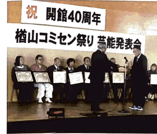
開館40周年を迎え、功労者や団体に感謝状を贈呈。記念の歌謡ショーを楽しむ(10月)