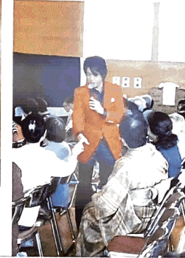
総合防災訓練を実施。AED操作など習い意識高める(11月)