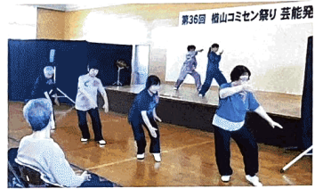
第36回 榎山コミセン祭り 芸能発表