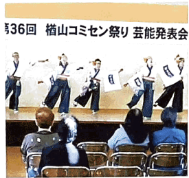
第36回 榎山コミセン祭り 芸能発表会