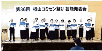
第36回 榎山コミセン祭り 芸能発表会