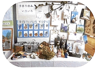
第36回 榎山コミセン