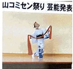
第36回 榎山コミセン祭り 芸能発表