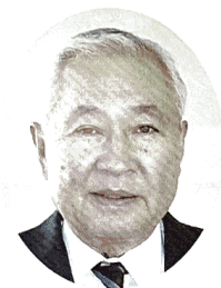
管理運営委員会 会長