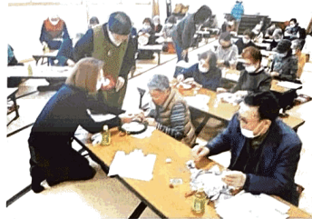
第3回サロン・ならこみを開催した。3密を避ける工夫の中、踊りやクリスマス飾り作りなど楽しんだ(12月)