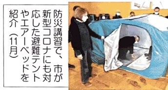
防災講習で、市が新型コロナウイルスに対応した避難所を説明(11月)