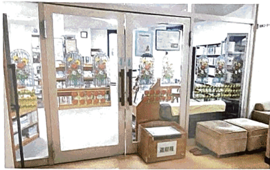
⑤図書コーナーは1階の事務室隣に ⑥子どもコーナーには、幼児向け絵本や偉人の伝記、図鑑なども