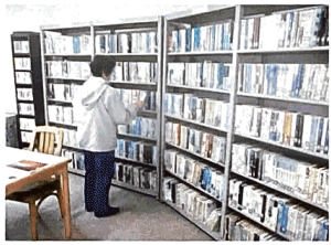
⑦貸し出しは台帳に記入。簡単な手続きで利用できる ⑧大人コーナー。作者別に小説など並ぶ