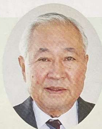
管理運営委員会 会長