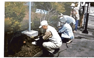
地区の高齢の方がテニスコート前にマリーゴールドを植えた(6月)