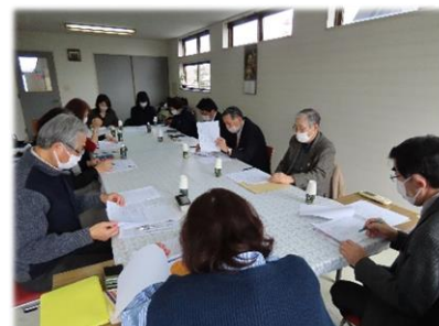
旭北高齢者ささえ愛協議会

八橋と旭北、それぞれのささえ愛協議会では、地域の高齢者の生きがいづくりや支え合うまちづくりについて定期的に集まり、意見を出し合っています。（八橋・旭北それぞれ年3回開催中）