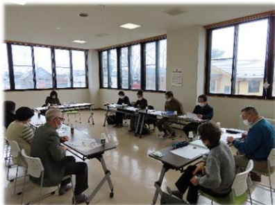
八橋高齢者ささえ愛協議会