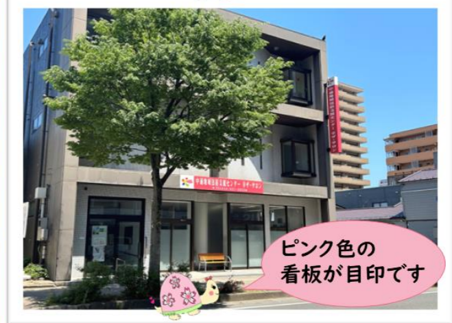
ピンク色の看板が目印です