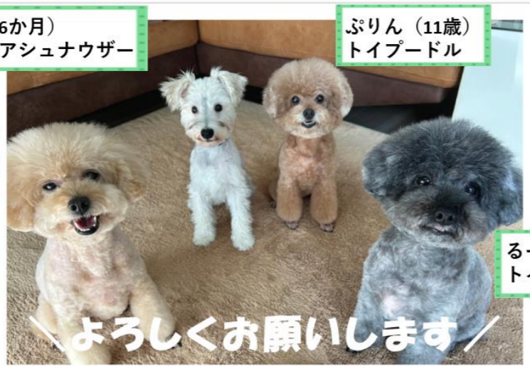
るーしー (8歳) トイプードル